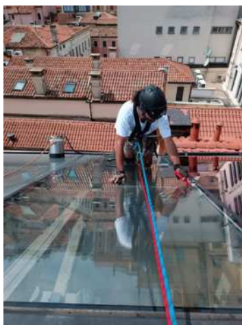
PULIZIA LUCERNAI IN FALDA CENTRO STORICO

La Eco service srl, si occupa anche della pulizia di ambienti e soprattutto la pulizia delle vetrate sia a livello strada che in quota, lavorando in sospensione con ausilio di funi e carrucole (edilizia acrobatica).