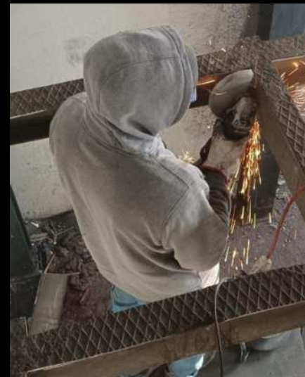
Dismissione Fabbrica Marghera